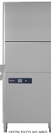
LP57H EVO2 HY-NRG Nové značení

mytí nádobí GN, tácu, přepravek černého nádobí