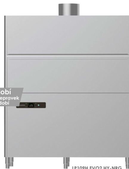
mytí nádobí GN, tácu, přepravky černého nádobí