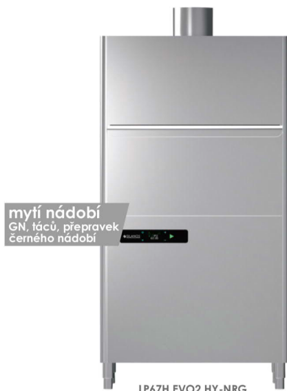
mytí nádobí GN, tácu, přepravky černého nádobí