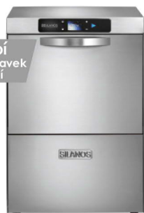
N800 EVO2 HY-NRG Nové značení

mytí nádobí GN, tácu, přepravek černého nádobí